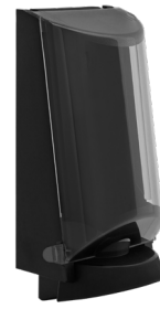
Art. nr. 3552 Dispenser 2,5 l av plast, svart med tonad trans- parent kåpa. Mått: 340 x 180 x 130 mm.