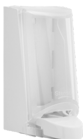
Art. nr. 4551 Dispenser 0,7 l av plast, vit med transparent kåpa. Mått: 200 x 115 x 120 mm.