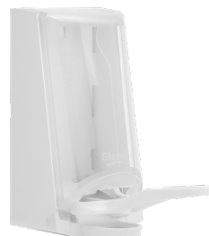
Art. nr. 4547 Dispenser 0,7 l av plast, vit med transparent kåpa. Underarmsdoser- are av plast. Mått: 200 x 110 x 200 mm.