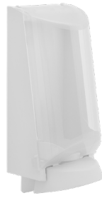
Art. nr. 3551 Dispenser 2,5 l av plast, vit med transparent kåpa. Mått: 340 x 180 x 130 mm.