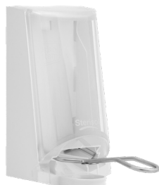
Art. nr. 4567 Dispenser 0,7 l av plast, vit med transparent kåpa. Underarmsdoser- are av metall. Mått: 200 x 110 x 200 mm.