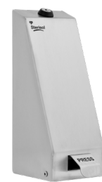
Art. nr. 4569 Dispenser 0,7 l, robust och låsbar av rostfritt stål. Mått: 260 x 102 x 140 mm.