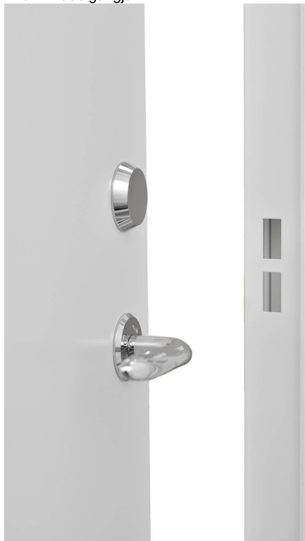
Slutbleck infällt i karmen