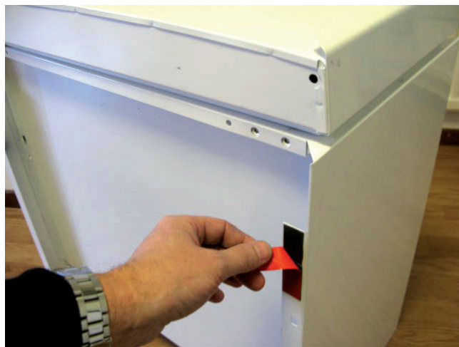
2. Innan skåpet lyfts på plats, tag bort skyddsfilmen på den dubbelhäftande tejp.