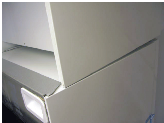
3. Skjut in skåpet under styrlisten.