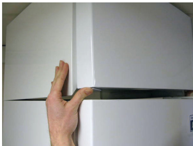
4. Ställ ner skåpet på den dubbelhäftande tejp.