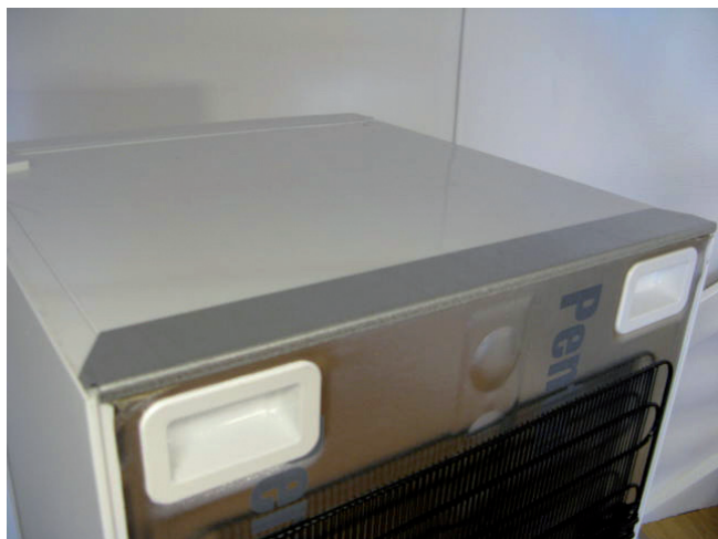
1. Montera listen på kylfrysenshetens övre bakkant.

Dörren på speceriskåp kan hängas om genom att man skruvar av båda gångjärnen och flyttar dem diagonalt till andra sidan.